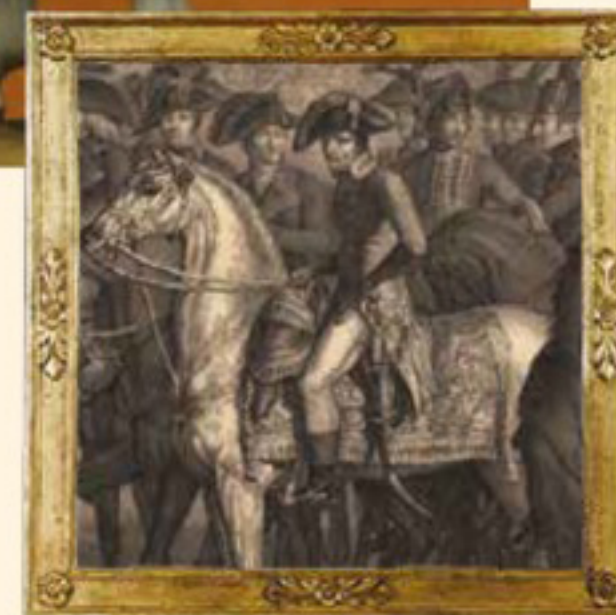
Isabey, Vernet, Pauquet, Mécou, Finot, Revue de general Bonaparte Premier Consul 1800 , (Napoleone, particolare) Coll. priv.

Il decreto del 14 nevosio anno VIII (4 gennaio 1800) stabiliva che le uniformi dei consoli dovranno essere realizzate "con il lustro che si conviene al governo di una grande nazione" e verrà perciò scelto il rosso, da sempre simbolo di comando. In realtà i consoli avevano a disposizione due uniformi, una rossa e una blu, la prima da usarsi nelle grandi cerimonie governative, la seconda per le funzioni ordinarie entrambe ricamate in oro. Per l'inverno era previsto un abito non a doppio petto, ma ad un unico petto con una sola fila di bottoni, in velluto rosso vivo che è