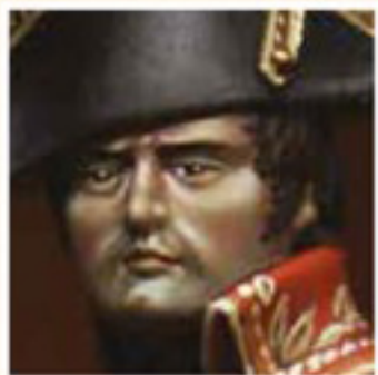
Napoleone Bonaparte (1769 - 1821) Primo Console